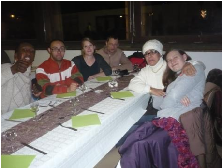
Soirée festive au village