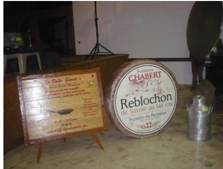
Le Reblochon, roi de la fête