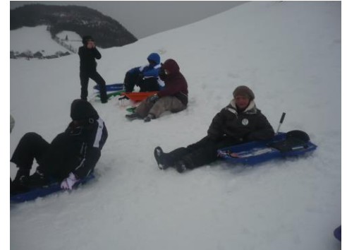
En avant pour une séance de glisse...