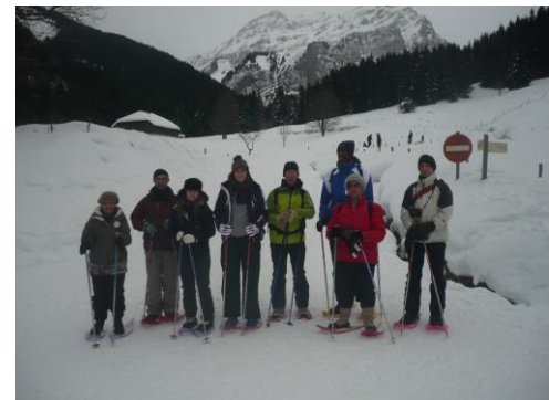
Prêts pour la randonnée ?