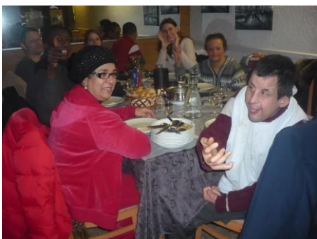
Un moment toujours agréable à partager ensemble