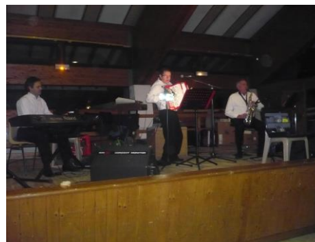
le rythme bat son plein