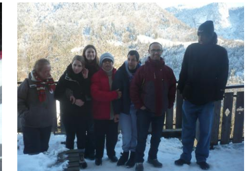
Direction la salle de classe pour apprendre à faire du fromage