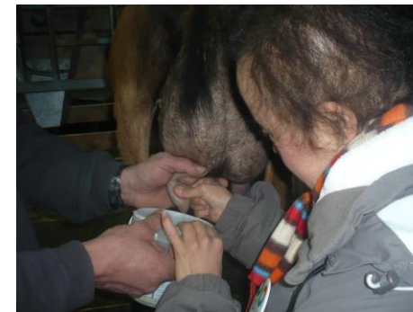
Une volontaire se lance...