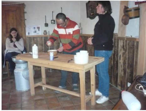
chacun des participants apporte sa petite touche à la fabrication d'un chevrotin