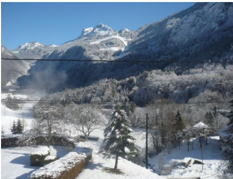
Quel paysage magnifique