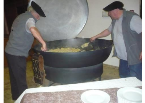
La tartiflette est prête...