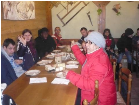
Après la fabrication....