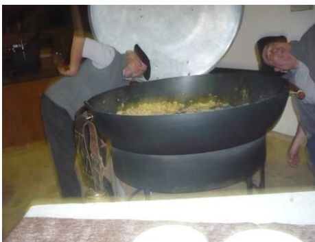
Hum ! ça sent bon...