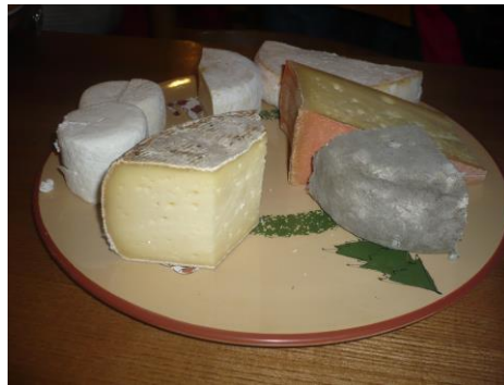
La dégustation .....