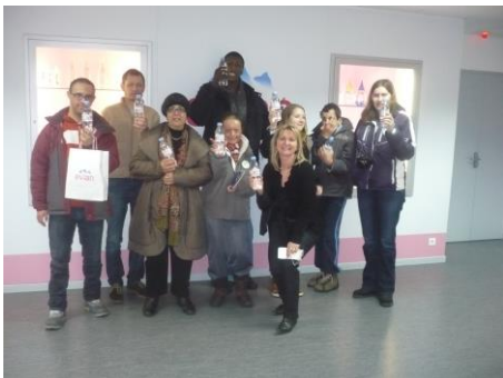
A chacun sa bouteille d'Evian...